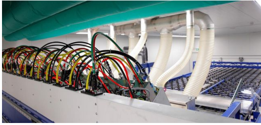
Laserlichtleitungen verbinden die Optiken mit den Lasern.