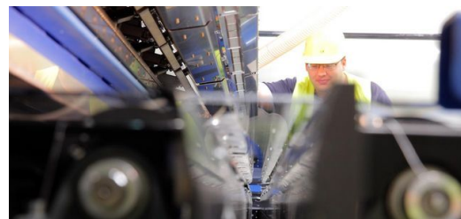
Strahlfallen befinden sich oberhalb und unterhalb der Laserlinie.