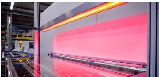
Eine weniger als 100 Mikrometer dünne Laserlinie erhitzt die Funktionsbeschichtung von Glasplatten ganz kurz auf über 500 Grad.

Lorenzo Canova, Projektleiter RTP bei Saint-Gobain Glass Deutschland: „Uns war klar, dass ein kurzer, hoher Wärmeeintrag, der die Beschichtung, nicht aber das Glassubstrat erhitzt, nur mit der hohen Leistung des Lasers möglich ist.“ Die Glasspezialisten entwickelten eine Laboranlage mit einer komplexen Laseranlage als Herzstück. Mit Rapid Thermal Processing entwarfen sie ein Verfahren, mit dem sie ihren eingeschlagenen Weg verifizieren konnten.