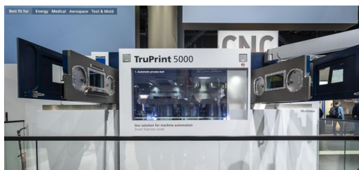
TruPrint 5000 mit automatischem Prozessstart