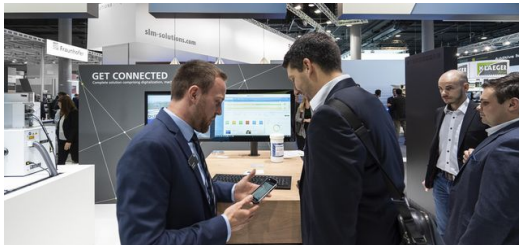
Alle 3D-Drucker des Messestands sind an ein digitales MES angebunden.

3D-Druck vollständig digital abwickeln lässt. Dafür hat TRUMPF alle 3D-Drucker des Messestands an ein Fertigungsmanagementsystem (MES) und eine intelligente Bestellplattform angebunden. Der Anwender lädt die Daten seines Bauteils hoch und erfährt sofort, was sein Auftrag kostet und wie lange die Lieferung dauert. Aber das ist noch nicht alles. Auch der Hersteller kann auf die Prozessdaten der Drucker und die anstehenden Aufträge zuzugreifen. Und zwar von jedem beliebigen Standpunkt aus und in Echtzeit.