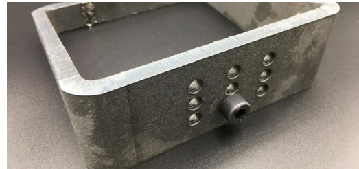
Mit der TruLaser Tube 7000 lassen sich verschiedene Gewinde einbringen.