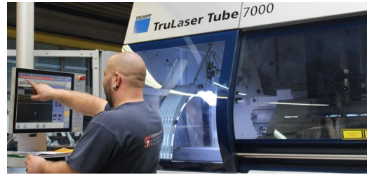
Der Maschinenbediener bekommt das fertige Programm auf sein Terminal, um das Gewinde ins Rohr zu schneiden.