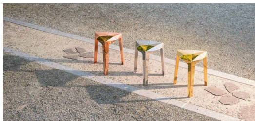
La silla "Orisu" en diferentes colores: un objeto simétrico fabricado con piezas uniformes y plegado en metal como en la técnica origami.