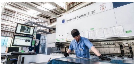
<p>Un trabajador opera la <a href="https://www.trumpf.com/es_INT/productos/maquinas-sistemas/maquinas-de-plegado/trubend-center-serie-5000/?_ga=2.65416105.682849121.1674658713-1960690640.1663834541&_gl=1%2A123f362%2A_ga%2AMTK2MDY5MDY0MC4xNjYzODMONTQx%2A_ga_0L82LGW77D%2AMTY3NDY1ODcxMi42MS4wLjE2NzQ2NTg3MjAuNTIuMC4w&cHash=5aa98af60d15f6c7cdf1ac4071ec9f3c">TruBend Center 5030</a>: así se fabrica la silla "Orisu". </p>