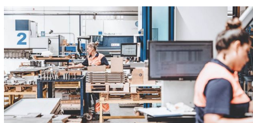
Un proyecto para todos: en el pedido del estadio participaron casi todos los departamentos de la empresa española.