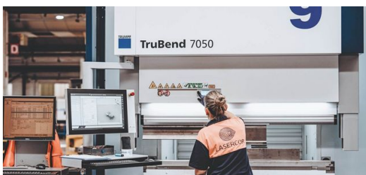
Lasercor ha cortado, doblado, grabado y soldado todo tipo de piezas con máquinas TRUMPF para unos 8.000 clientes.