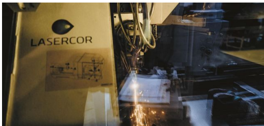
Corte por láser, soldadura, grabado: Lasercor utiliza una amplia gama de soluciones de TRUMPF