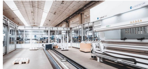
Todas las máquinas láser de TRUMPF ya están conectadas en red.