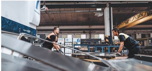
Lasercor decidió que necesitaba una máquina de corte por láser para cubrir el vacío de suministro y producir ella misma las piezas de chapa adecuadas.

Desde entonces, Lasercor no ha parado de crecer. De 400 metros cuadrados de taller a 16 000 metros cuadrados de instalaciones. De una máquina TRUMPF a 23, de una TruBend 5130 a una TruLaser 5030 fiber , una TruLaser Weld 5000 y una TruMark Station 7000 . Hoy en día, la empresa tiene 170 empleados y una facturación anual de 30 millones de euros. Lasercor ha cortado, plegado, grabado y soldado piezas de todo tipo para unos 8000 clientes empleando para ello máquinas TRUMPF. A veces se trataba de un pedido para una empresa muy pequeña, a veces era un pedido recurrente para grandes corporaciones. A veces se trataba de señales de tráfico o electrodomésticos, a veces de máquinas, plantas enteras o grandes aerogeneradores. O el mundialmente famoso Estadio Santiago Bernabéu.