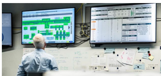
<p>Todo de un vistazo: en la llamado «sala de control», los monitores y cuadros de mando muestran en directo dónde se encuentra cada componente en el almacén.</p>