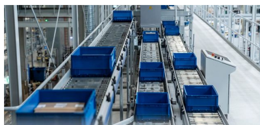
<p>Hasta 120 cajas circulan simultáneamente a una altura de cinco metros por encima el suelo de la nave transportando los repuestos a las distintas estaciones.</p>