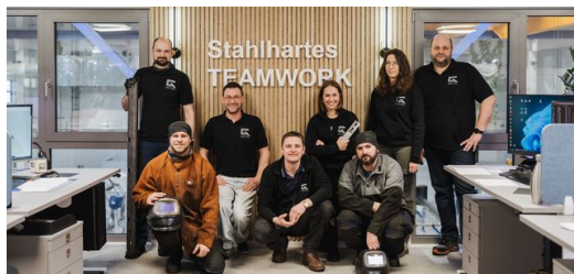
<p><strong>Sentido de pertenencia: </strong>en última instancia, el éxito y la calidad solo tienen un origen: el equipo.</p>

La valentía de ampliar su modelo de negocio con nuevas tecnologías ha dado sus frutos. Actualmente, Götzl colabora con otros proveedores de servicios de corte de tubos por láser en pedidos de gran volumen y fabrica una amplia variedad de piezas, incluso en grandes series, por ejemplo, para cajas móviles de vehículos, almacenes de estantes elevados, mobiliario de asiento y sistemas de energía solar. Cuando la primera TruLaser Tube 7000 alcanzó su capacidad máxima con funcionamiento de tres turnos, adquirió una segunda en 2017. Y pronto quedó convencido no solo de las máquinas, sino también del servicio técnico de TRUMPF.