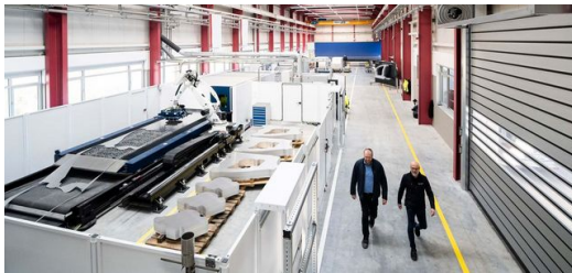
<p>La instalación de Laser Blanking de 34 metros de largo ahorra materia prima y unas 4000 toneladas de CO2 cada año.</p>