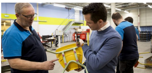
<p>Fabricadas para una larga trayectoria escolar: sillas como la silla Gispén WIZZ son estables y robustas. y llenan de color la jornada escolar.</p>

Esta filosofía está arraigada en los valores sostenibles que caracterizan la actividad empresarial dentro del Grupo Royal Ahrend. También en el diseño de productos: «Somos pioneros en el campo de la sostenibilidad y el diseño circular», explica el director de la fábrica. «Todos nuestros muebles son modulares, por lo que son más fáciles de reparar, reutilizar y reciclar». Además, consiguen una reducción de las emisiones de CO 2 , ya que el mobiliario escolar de Gispén se fabrica exclusivamente en los Países Bajos y se vende principalmente allí. De este modo, se evitan largos trayectos de transporte. En la medida de lo posible, también se utilizan materiales sostenibles. El último ejemplo es la silla Gispén WIZZ. El cuerpo del asiento de esta silla de colores vivos está fabricado con cajas de fruta de plástico recicladas. «Además, acompaña desde el principio hasta el final de la etapa escolar. Gracias a la variedad de modelos y tamaños de los asientos y las estructuras, la silla se ha diseñado para adaptarse a cada etapa del aprendizaje», señala Goossens. «Todas estas medidas son componentes esenciales de nuestra identidad de marca y estrategia de producto. Si es bueno para el medio ambiente, es bueno para toda la sociedad».