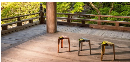
La silla "Orisu" es algo especial: convierte tecnologías abstractas en algo visible para el observador.