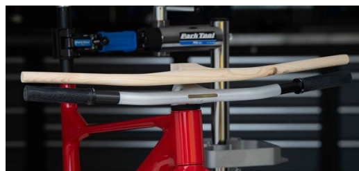
<p class="MAGAFIetext">Cavernícola: así describía Dangerholm su modelo de madera en comparación con el manillar fabricado por