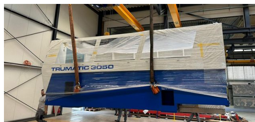
Carga pesada: la barra de siete toneladas al llegar a la nave de montaje de la empresa Matyssek Metalltechnik.