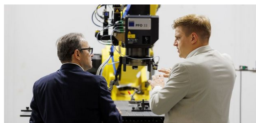
<p>Pour permettre un soudage rapide et flexible de pièces structurelles revêtues et de grand format, Gestamp a développé, en collaboration avec TRUMPF, un processus de soudage laser adapté à l'industrie.</p>