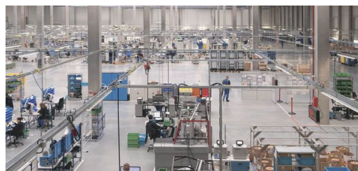
<p>Des générateurs spéciaux pour chaque application : des générateurs pour la branche des semi-conducteurs sont obtenus à partir de nombreux composants partiellement conçus de façon automatisée.</p>