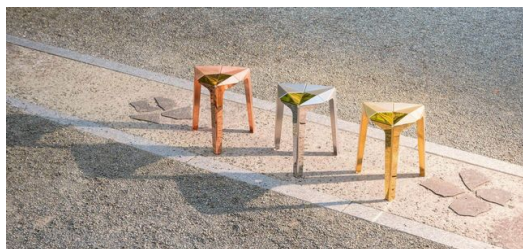
La chaise « Orisu » en différentes couleurs : un objet symétrique composé de pièces de la même forme et de métal plié comme de l'origami.

« Grâce à l'entreprise KANEYOSHI, je transforme des technologies abstraites en mobilier domestique. Cela permet aux gens de faire l'expérience de la beauté du métal au plus près et de comprendre ce métier », explique Ishida. Le mobilier domestique en question est une chaise appelée « Orisu ».