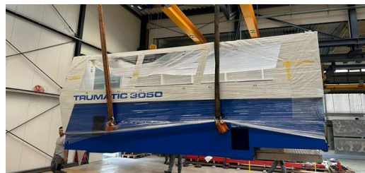
Chargement imposant : le bar de sept tonnes à l'arrivée dans l'atelier de montage de l'entreprise Matyssek Metalltechnik.