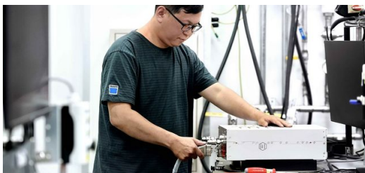
<p>Les générateurs de TRUMPF approvoient le courant et règlent l'intensité, la tension et la fréquence du courant à une valeur hautement précise.</p>

Les zones exposées sont ensuite éliminées par décapage dans un processus plasma, de façon à créer les pistes conductrices les plus fines dans la matière. Ici aussi, les générateurs TRUMPF jouent un rôle important afin de contrôler ces processus de décapage complexes.