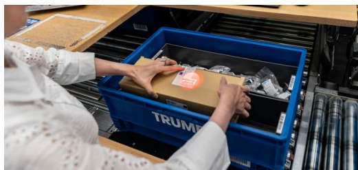
<p>Aide numérique : un marquage lumineux de couleur indique aux employés quels composants ils doivent placer dans quelle caisse.</p>

La bande transporteuse qui serpente dans l'atelier s'appelle « la boucle ». Elle distribue les composants stockés dans les caisses aux différents postes pour la suite du traitement. « Sans la boucle, tout s'arrête ici », explique Türk. Jusqu'à 120 caisses de pièces peuvent s'y trouver en même temps. Le cœur du centre logistique de TRUMPF est le magasin automatisé pour petites pièces, desservi par un monte-charge automatisé. L'entreprise tient 75 % des pièces en stock. Comme par magie, un monte-charge sort les pièces de leur emplacement et les amène au poste de préparation des commandes. Environ 1500 commandes quittent ainsi le centre logistique chaque jour.