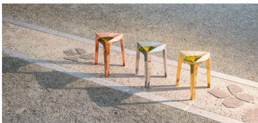
La chaise « Orisu » en différentes couleurs : un objet symétrique composé de pièces de la même forme et de métal plié comme de l'origami.