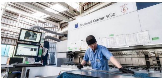
<p>Un employé travaille sur la <a href="https://www.trumpf.com/fr_INT/produits/machines-systemes/presse-pieuses/trubend-center-serie-5000/?_ga=2.65416105.682849121.1674658713-1960690640.1663834541&_gl=1%2A123f362%2A_ga%2AMTK2MDY5MDY0MC4xNjYzODMONTQx%2A_ga_0L82LGW77D%2AMTY3NDY1ODcxMi42MS4wLjE2NzQ2NTg3MjAuNTIuMC4w&cHash=5aa98af60d15f6c7cdf1ac4071ec9f3c">TruBend Center 5030</a> : voilà comment la chaise « Orisu » est produite.</p>