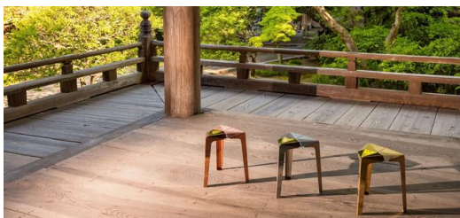
La chaise « Orisu » est très particulière : elle rend des technologies abstraites visibles à l'observateur.