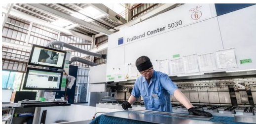
<p>Un employé travaille sur la <a href="https://www.trumpf.com/fr_INT/produits/machines-systemes/preses-pieuses/trubend-center-serie-5000/?_ga=2.65416105.682849121.1674658713-1960690640.1663834541&_gl=1%2A123f362%2A_ga%2AMTK2MDY5MDY0MC4xNjYzODMONTQx%2A_ga_0L82LGW77D%2AMTY3NDY1ODcxMi42MS4wLjE2NzQ2NTg3MjAuNTIuMC4w&cHash=5aa98af60d15f6c7cdf1ac4071ec9f3c">TruBend Center 5030</a> : voilà comment la chaise « Orisu » est produite.</p>