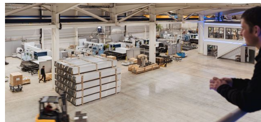
<p><strong>Chicago vous salue :</strong> sur le modèle de l'Usine du Futur TRUMPF, Peter Götzl a su créer un atelier de tôlerie entièrement automatisé à Erbdorf.</p>