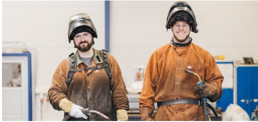
<p><strong>Forte activité dans un atelier high-tech : </strong>certaines employés de la production continuent à travailler à la main, bien protégés dans leur tenue de soudeur. </p>