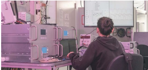
<p>A plazmalaboratórium egyik munkatársa je kiértékeli a kamrák belsejében zajló folyamatokat.</p>