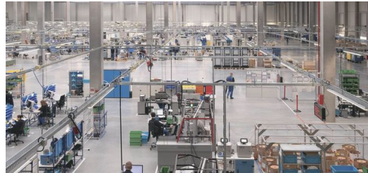
<p>Speciális generátorok minden alkalmazáshoz: Számos részben automatizálva gyártott komponensből generátorok készülnek a félvezetőipar számára.</p>