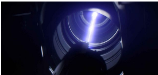
<p>Extrém ultraibolya (EUV) fény rajzolja a későbbi vezetékpályákat apró mintákként a fényérzékeny festékre.</p>