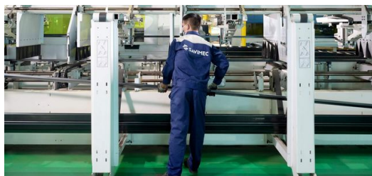
Negli ultimi anni, in Vietnam è aumentata la domanda di taglio laser di tubi. Con la TruLaser Tube 5000 fiber SAVIMEC serve il mercato in crescita.