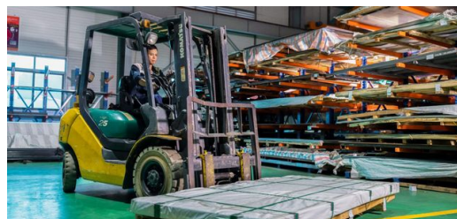
Con processi di lavorazione sincronizzati e molte fasi di produzione automatizzate, Ngo Sach Vinh vuole che SAVIMEC diventi il maggiore produttore conto terzi del Vietnam, in grado di competere anche a livello internazionale.