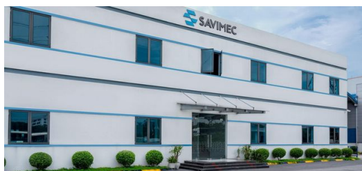
SAVIMEC svolge la sua attività produttiva in uno stabilimento di 12.000 metri quadrati al centro dell'importante triangolo economico formato da Hanoi, Quang Ninh e Hai Phong.