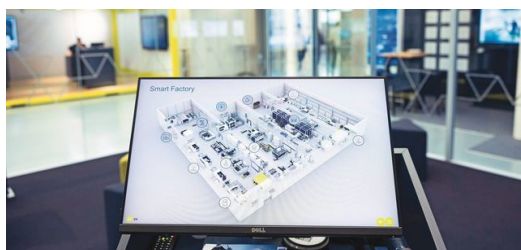
Dane maszynowe, które TRUMPF zbiera w swojej Smart Factory, pomagają zespołowi Computer-Vision trenować AI.