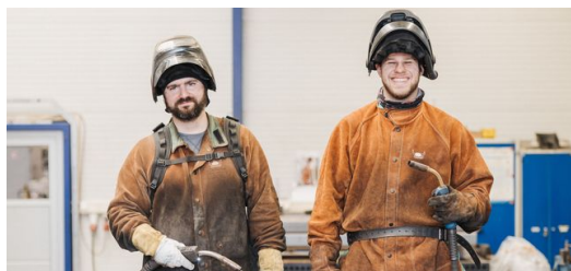
<p><strong>Alta produção na oficina de alta tecnologia: </strong>Os funcionários da produção ainda fazem algumas tarefas manualmente, bem protegidos com roupas de soldadores. </p>