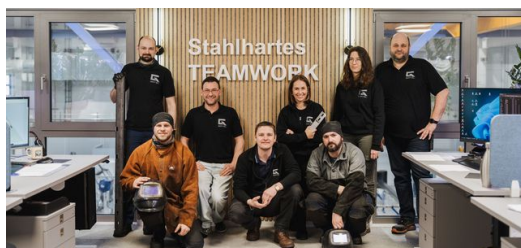
<p><strong>Sensação de grupo: </strong>No fim, o sucesso e a qualidade são mérito do time.</p>

A coragem de ampliar o seu modelo de negócio com a nova tecnologia valeu a pena. Götzl agora apoia outros prestadores de serviços de corte de tubos a laser com grandes pedidos e produz uma ampla gama de peças, incluindo grandes séries, por exemplo, para carrocerias intercambiáveis para veículos de transporte, armazéns altos, móveis para assentos e sistemas de energia solar. Quando a primeira TruLaser Tube 7000 foi totalmente ocupada na operação de três turnos, ele comprou uma segunda em 2017. E em breve ele ficará impressionado não apenas com as máquinas, mas também com a assistência da TRUMPF.