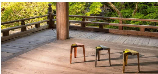
A cadeira "Orisu" é algo especial: ela torna tecnologias abstratas visíveis para quem a observa.

Yoshida não é o único que se envolveu com a arte em Kawaguchi: todos os anos, as fábricas realizam o Kawaguchi Machi-ka Art Festival , do qual Kazuhito Ishida é o diretor desde o ano passado. Várias obras de arte criadas em colaboração entre fábricas e designers são exibidas no festival. "A arte enriquece a vida das pessoas. Ela pode não ser necessária para a sobrevivência diante das crises atuais, mas sempre consegue colocar um sorriso no rosto das pessoas", diz Ishida. Assim, a cidade japonesa de Kawaguchi está passando por uma transição especial: de uma clássica cidade industrial com imagem antiquada para um lugar de design e arte; um lugar onde as pessoas vêm para se sentir bem.