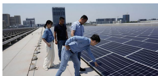
A TRUMPF China é o primeiro local de operação que usa somente energias renováveis.