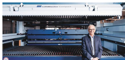
Em combinação com o LiftMaster Compact e o Part Master, o sistema corta as peças na produção do fabricante do balcões refrigerados de forma