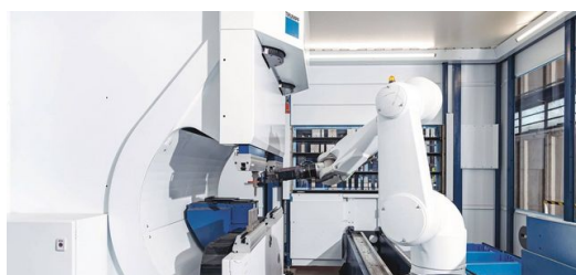
Célula de dobra inovadora de alta velocidade: A TruBend Cell 7000 é um sistema compacto que pode ser usado para dobrar peças pequenas de

José Júlio Jordão fundou a empresa em 1982 em Guimarães, norte de Portugal. Tudo começou com 22 funcionários. A força de trabalho aumentou mais de dez vezes, para 250 funcionários. A Jordão é hoje um dos principais fabricantes europeus de balcões refrigerados personalizados e padrão para as indústrias de varejo alimentício e hotelaria e tem clientes bem conhecidos em todo o mundo, o último faturamento foi de 21,5 milhões de euros.