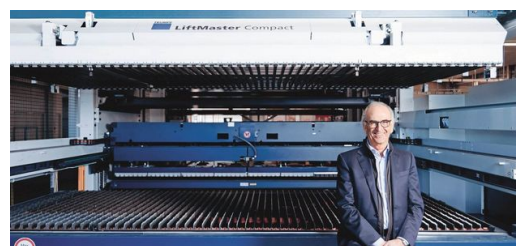
În combinație cu LiftMaster Compact și Part Master, sistemul taie piesele complet automatizat în linia de producție a producătorului de vitrine