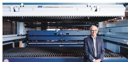
Systém plnoautomaticky vyrezáva dielce v závode výrobcu chladiacich vitrín