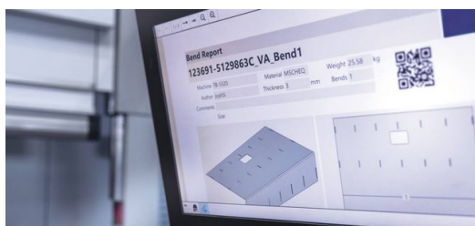
<p>Softvérom podporované riadenie výroby je vo firme Freightler Group takisto základným pilierom automatizácie.</p>