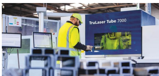
<p>V oblasti presnosti a prehľadnosti urobila výroba firmy Freightler Group obrovský krok vpred – z toho sa tešia aj zamestnanci.</p>