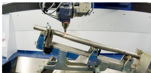
Med 3D-lasermaskinen TruLaser Cell 8030 från TRUMPF kan man skära ut exakta konturer som inte kan utföras före bockningen eftersom de då skulle deformeras.