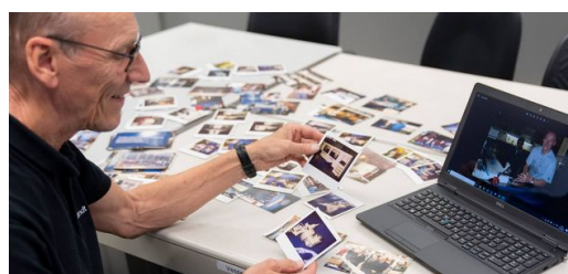
<p>Minnen av en tid som flytt: Tusentals kort har tagits under de många åren hos TRUMPF.</p>