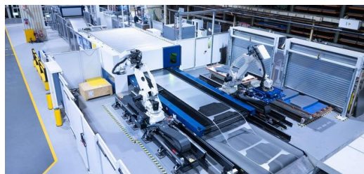
<p class="MAGAFIetext">En fullständig bild av TruLaser 8000 Coil Edition: