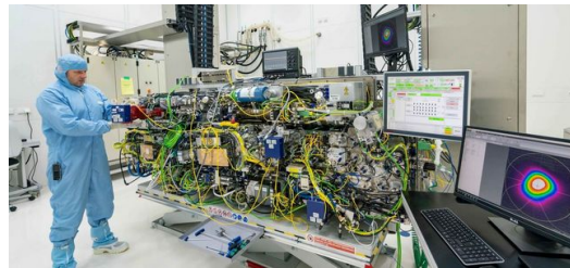
<p>Çip üretiminin kalbi: Dünyanın en güçlü puls endüstriyel lazerinin bir bileşeni, EUV litografisini mümkün kılmak için ışık üretiminde kapsamında kullanılmaktadır.</p>