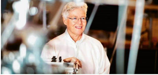
Prof. Anne L'Huillier geçmişte de attosaniye lazer pulsı fiziğinin kapılarını açmıştı. Günümüzde ise araştırmalarında elektronlara odaklanıyor.

L'Huillier: Kesin bir vizyon ortaya koymak kolay değil. Sonuçta bu temel bir araştırma.